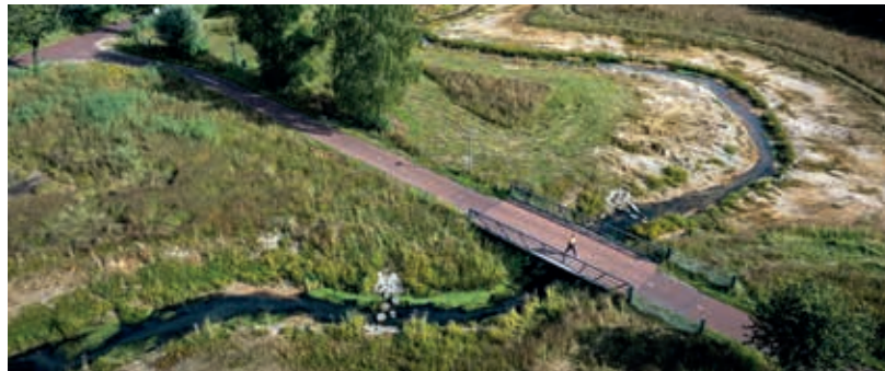
De meanderende Gulden Aa bij het Janus Meulendijkspad in Aarle-Rixtel

Nu is 't Gulden Land veranderd naar een mooi gebied met aandacht voor natuur, water, cul-