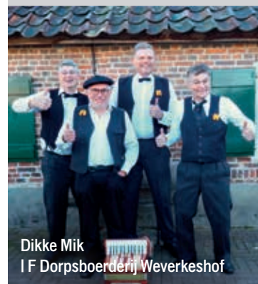
Dikke Mik I F Dorpsboerderij Weverkeshof

Heeft u ons in het jubileumjaar gemist of wilt u nog eens een opluistering bijwonen, dan is dat zondag 16 maart uw kans. We treden dan op in het Weverkeshof in Nuenen. Van 14.00 tot 16.30 uur bent u welkom en trakteren we u op een gezellige middag. Adres: Jhr. Berckellaan 5 Nuenen.