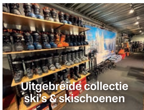
Uitgebreide collectie ski's & skischoenen