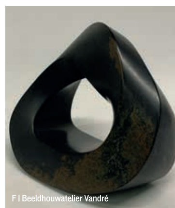
F | Beeldhouwatelier Vandr 