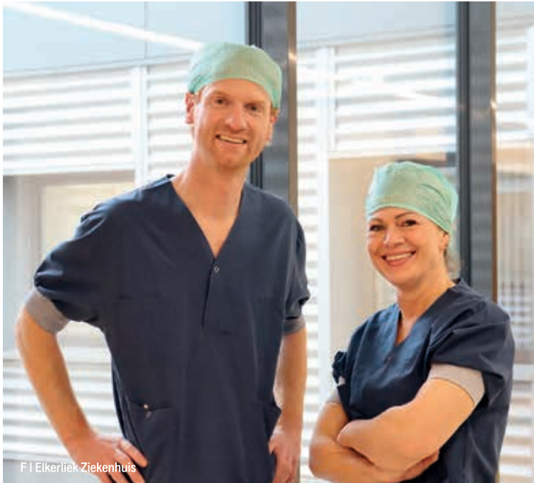
F | Elkerliek Ziekenhuis

‘Aandacht voor de mens achter de patiënt staat centraal’