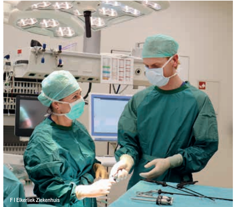
F | Elkerliek Ziekenhuis

Al vele jaren staat het Elkerliek ziekenhuis bekend om haar Expertisecentrum voor lies- en buikwandbreuken. Sinds 2008 ontwikkelde het ziekenhuis op dit gebied een specialisatie. Chirurgen uit het hele land kwamen naar Helmond om te zien hoe de liesbreuk met een speciale minimaal invasieve techniek met succes wordt behandeld. Duizenden patiënten en meer dan vijftien jaar later is het Elkerliek nog altijd een van de koplopers als het gaat om de behandeling van liesbreuken.