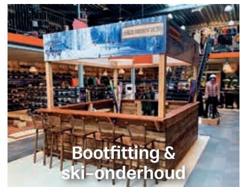
Bootfitting & ski-onderhoud