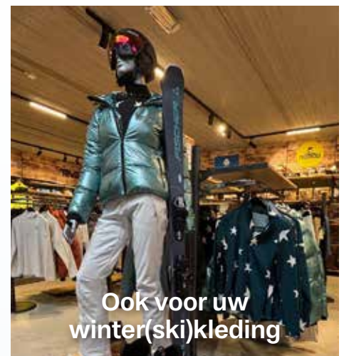
Ook voor uw winter(ski)kleding