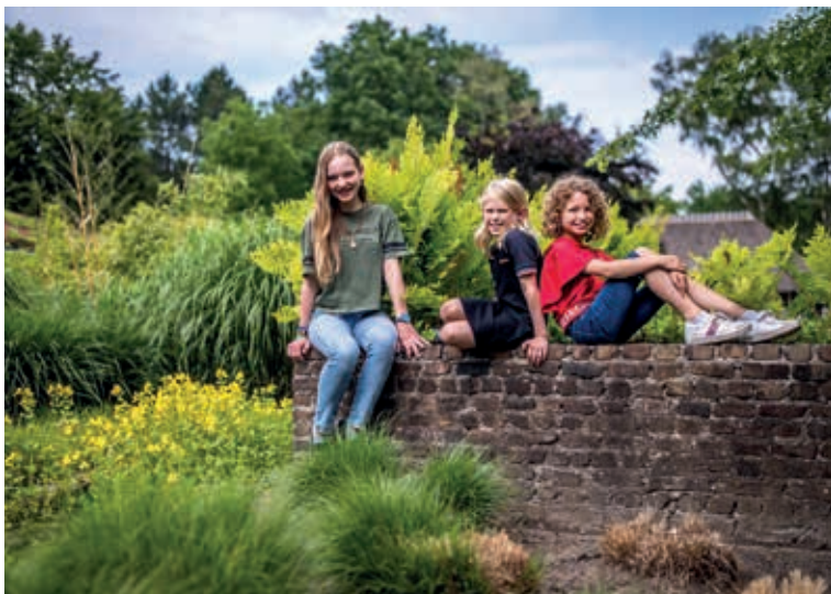
Kinderen in de museumtuin van Museum Klok &amp; Peel

ASTEN In Museum Klok & Peel aan de Ostaderstraat 23 in Astén vindt woensdagmiddag 8 april van 14.00 tot 16.00 uur weer een kindermiddag met een thema plaats. Dit keer is het actuele seizoen de inspiratiebron. Vandaar dat de middag 'Naar buiten, het wordt weer voorjaar' is gedoopt.