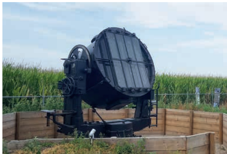
Een zoeklicht | F Stichting Wehrmachthuisje Someren-Heide

Kijk voor entreprijzen op www.wehrmachthuisje.nl .