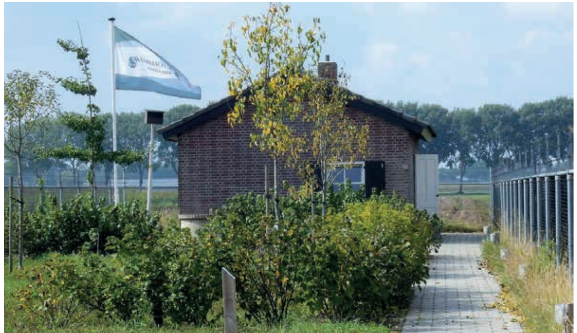
Het Wehrmachthuisje | F Stichting Wehrmachthuisje Someren-Heide

De vrijwilligers van het Wehrmachthuisje geven rondleidingen in hun mini-museum en organiseren lezingen. Verder heeft de stichting QR-codes geplaatst bij oorlogsmonumenten in de gemeente Someren. Als mensen deze code scannen, kunnen ze direct het verhaal achter het monument lezen.