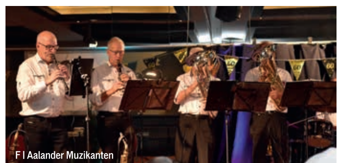
F | Aalander Muzikanten

BAKEL Op eerste paasdag, zondag 5 april, geven de Aalander Muzikanten hun jaarlijkse Paasconcert. Van 13.00 tot 15.00 uur brengen zij in Zaal 't Viltje in Bakel een spiksplinternieuw repertoire. De zaal is open vanaf 12:30 uur. Het programma bestaat uit Böhmische en Mährische blaasmuziek, aangevuld met zang. Bezoekers kunnen rekenen op een sfeervolle en muzikale middag. De entree is gratis