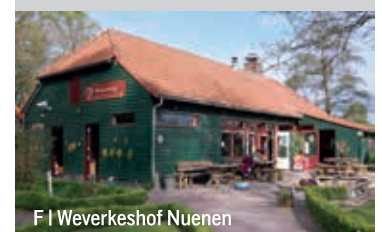
F | Weverkeshof Nuenen

Kijk dan op www.weverkeshof.nl voor meer informatie en om je aan te melden.