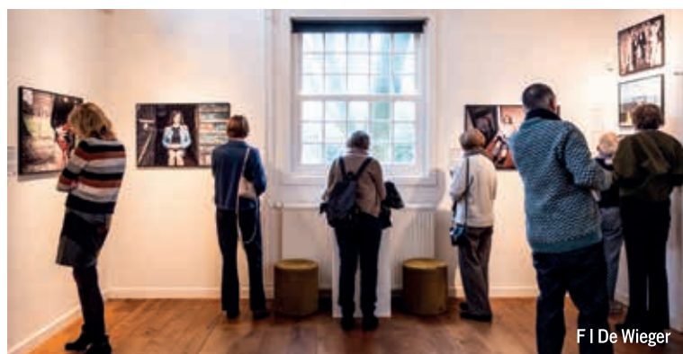
F | De Wieger

De symposiummiddag vindt plaats in De Ateliers van De Wieger, op 3 mei van 13.00 tot 16.00 uur. De entree is gratis, een vrijwillige bijdrage voor museum en kunstenaar wordt op prijs gesteld. Tevoren aanmelden is niet nodig.