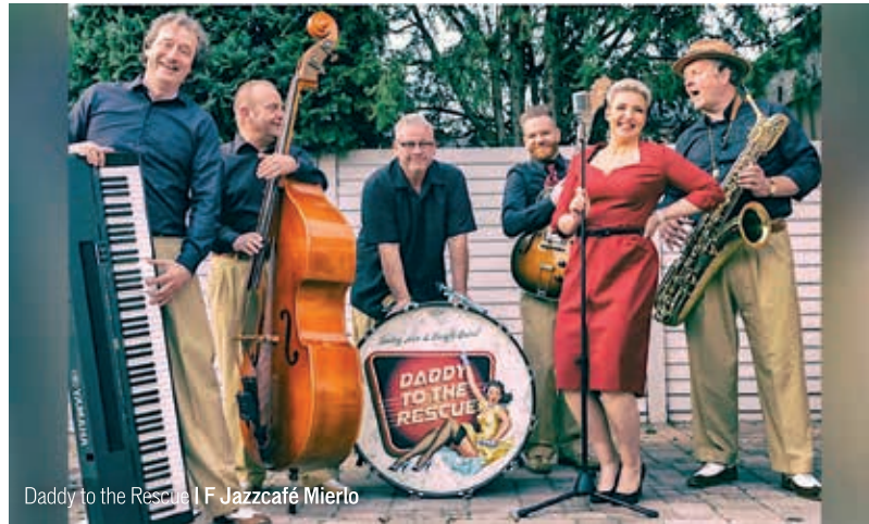
Daddy to the Rescue | F Jazzcafé Mierlo

8 april 2026, 20.00 uur, de zaal is open vanaf 19.30 uur Locatie: Jazzcafé Mierlo, Heer van Scherpenzeelweg 14 in Mierlo Meer informatie op www.jazzcafemierlo.nl .