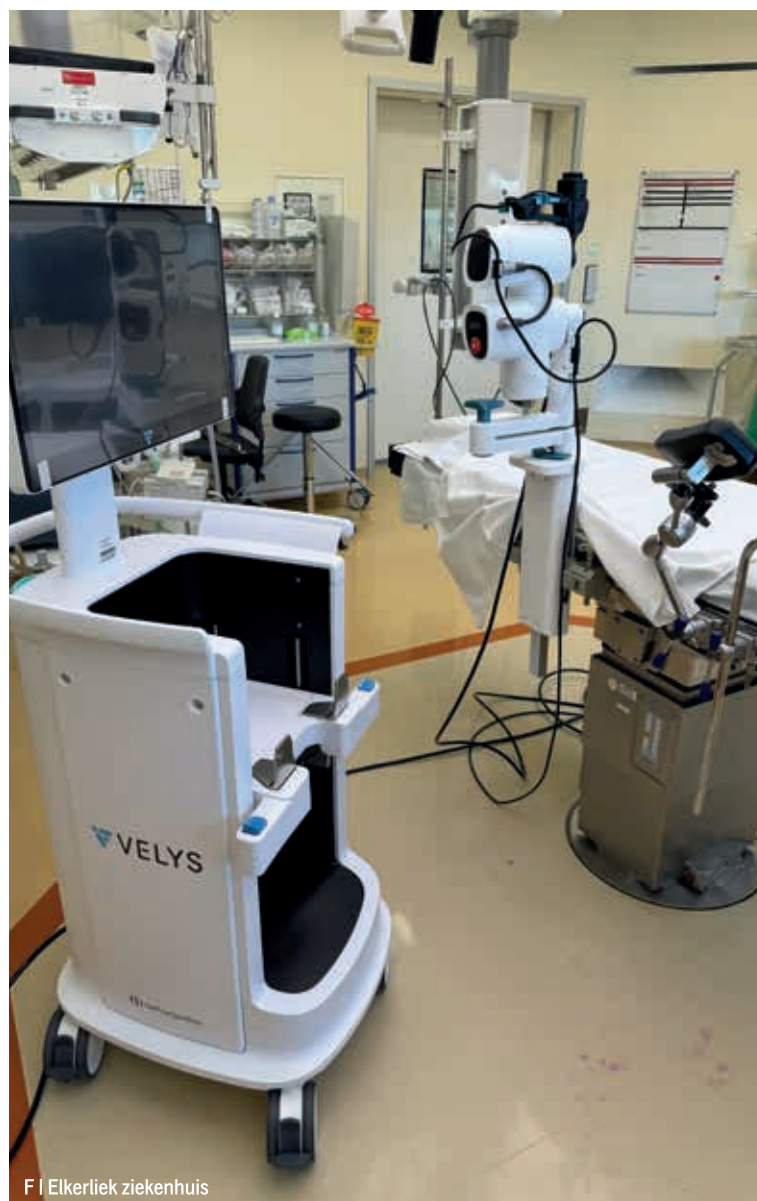
F | Elkerliek ziekenhuis

In de afgelopen maanden zijn de eerste orthopeden en OK-assistenten getraind in het werken met de robot. Vanaf 3 maart wordt een eerste groep patiënten met behulp van de robot geopereerd. Aanvankelijk wordt de robot alleen ingezet bij volledige knieprothesen. Later is het de bedoeling om deze ook te gebruiken bij de vervanging van het halve kniegewricht.