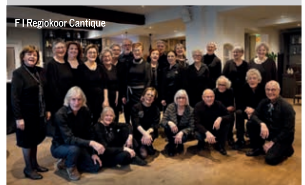
F | Regiokoor Cantique

Naast de muzikale ambitie staat Cantique bekend om zijn hechte en gezellige koorcultuur. Vieringen, informele optredens en spontane muzikale acties zorgen voor een familiale sfeer waarin iedereen zich snel thuis voelt. Nieuwsgierig geworden? Op regiokoorkantique.nl vind je alles over meezingen bij ons koor.