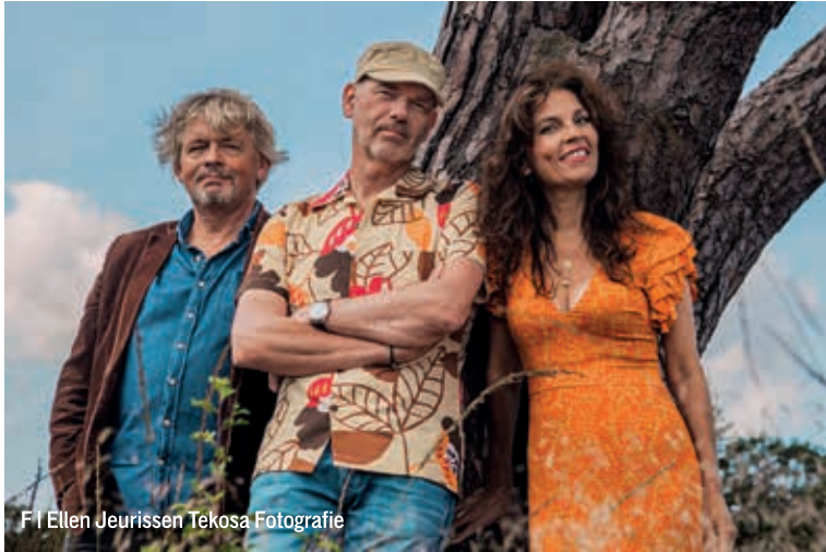
F | Ellen Jeurissen Tekosa Fotografie