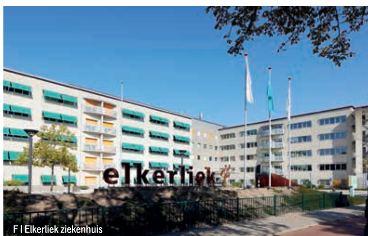
F | Elkerliek ziekenhuis

De wachttijd voor het plaatsen van een knieprothese bedraagt momenteel vier tot zes weken. Voor een consult bij de polikliniek Orthopedie kunt u doorgaans binnen een tot twee weken terecht.