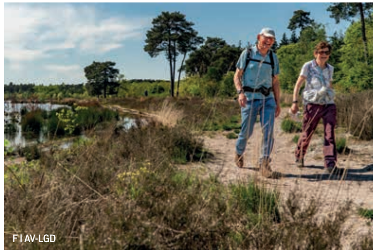
F | AV-LGD

De afstanden 30 en 40 km kunnen tot uiterlijk 10.00 uur inschrijven, de 15 km en 20 km tot 12.00 uur en de 5 km en 10 km